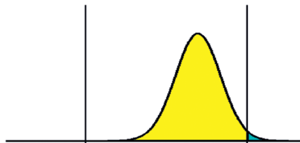
Figuur 3. Voorbeeld van een scoreberekening: 95% van de curve bevindt zich tussen de onder- en bovengrens.

bekend patroon in verschillende rondes terugkomen. Nadat alle uitslagen van het gehele jaar bekend zijn, kunnen de verschillende duploresultaten gecombineerd worden en daaruit een imprecisie worden bepaald. Het voordeel van deze benadering is dat de imprecisie op basis van duplowaarden ongevoelig is voor niet-lineariteit van de gebruikte analyseapparatuur en/of analysemethode. Door de duplo-imprecisie te vergelijken met de imprecisie uit de regressieanalyse, kan een uitspraak worden gedaan over een eventueel aanwezige niet-lineariteit. De significantiegrens is afhankelijk van het aantal paren en het gewenste significantieniveau. Concreet: bij een aantal van 24 monsters (12 duploparen) is er met 99% zekerheid sprake van niet-lineariteit als de duplo-imprecisie kleiner is dan 0,63 maal de regressie-imprecisie.